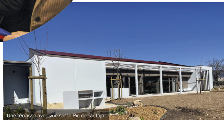
Une terrasse avec vue sur le Pic de Tantajo.

Sur la scène, plusieurs discours ont rythmé cette célébration, mettant en avant la qualité architecturale de cet espace de 125 places assises