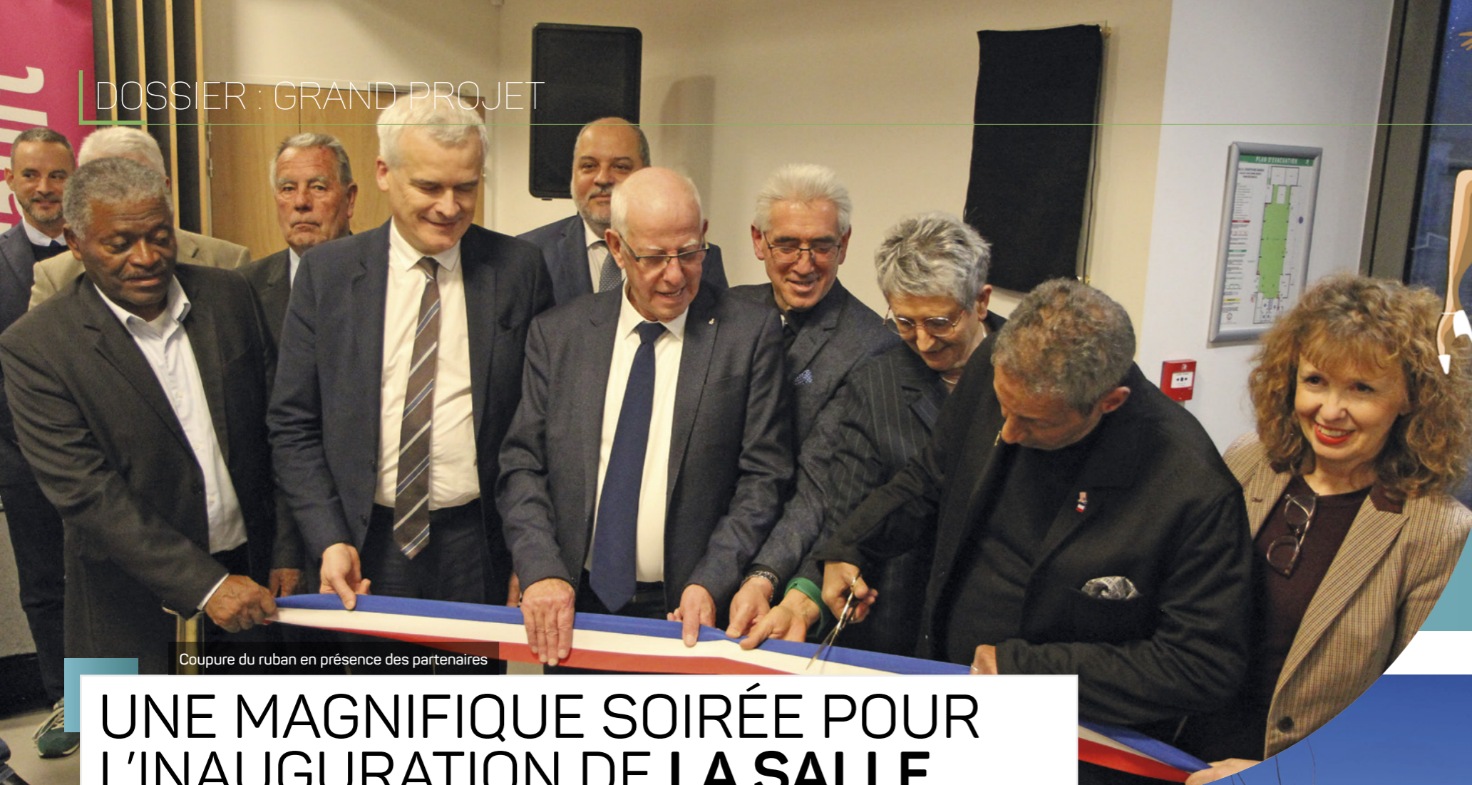
Coupure du ruban en présence des partenaires