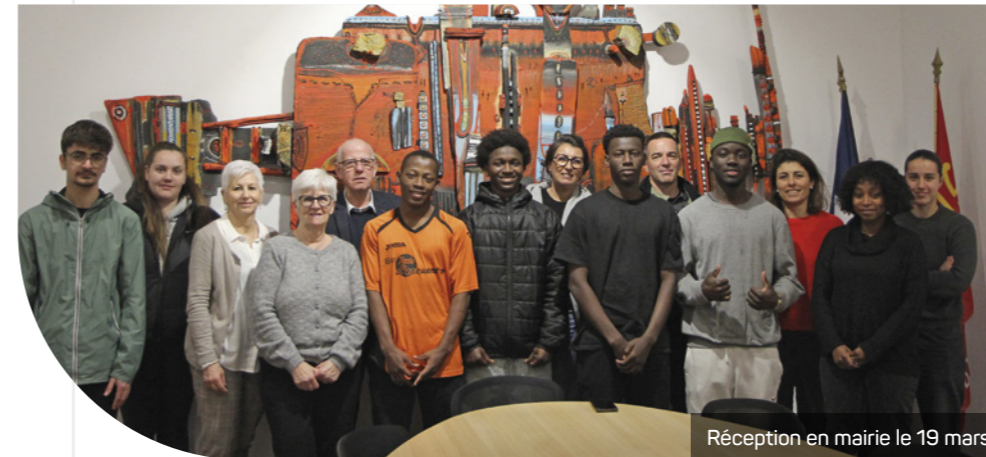
Réception en mairie le 19 mars

Dans le cadre de ses compétences en matière de protection de l'enfance, le Département de l'Hérault, en partenariat avec l'Association Nationale de Recherche et d'Action Solidaire (ANRAS), prend en charge dans plusieurs villes du département, des jeunes mineurs non accompagnés.