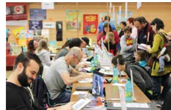
Le Festival BD'Hérépian attire des centaines de visiteurs chaque année