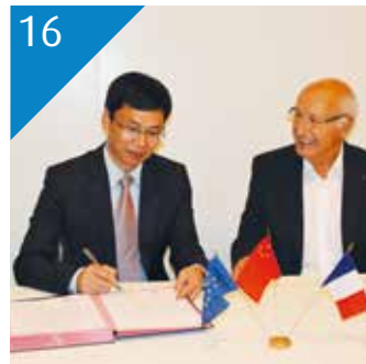
16 ÉCONOMIE La coopération avec la Chine donne un élan à l'activité économique de Grand Orb