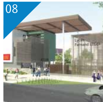
08 ÉDUCATION Un nouveau lycée professionnel en construction