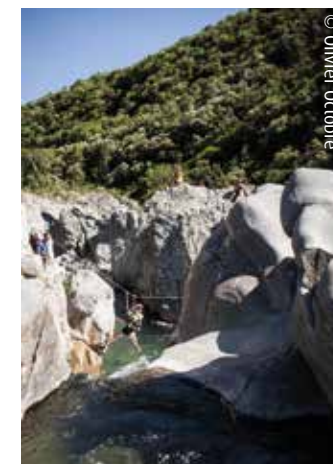
L'association Taill'Aventure est soutenue par la Communauté de communes

En plus des associations culturelles soutenues en 2016, Grand Orb a été notamment partenaire du Taill'Aventure, du Grand Raid 6666, de Hauts Cantons Passions organisé au Bousquet d'Orb, ou encore de l'Estivale des petits métiers à la Tour sur Orb par l'association Lou Récantou.