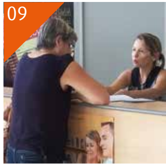
09 TOURISME L'Office de Tourisme Intercommunal est en place