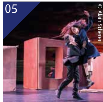
05 DOSSIER La culture pour vous, avec vous !