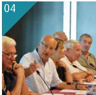
04 RETOUR SUR... Les décisions prises en conseil communautaire, en commission, en conférence des Maires