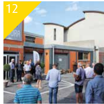
12 EN BREF Les actus : économie, environnement, enfance...