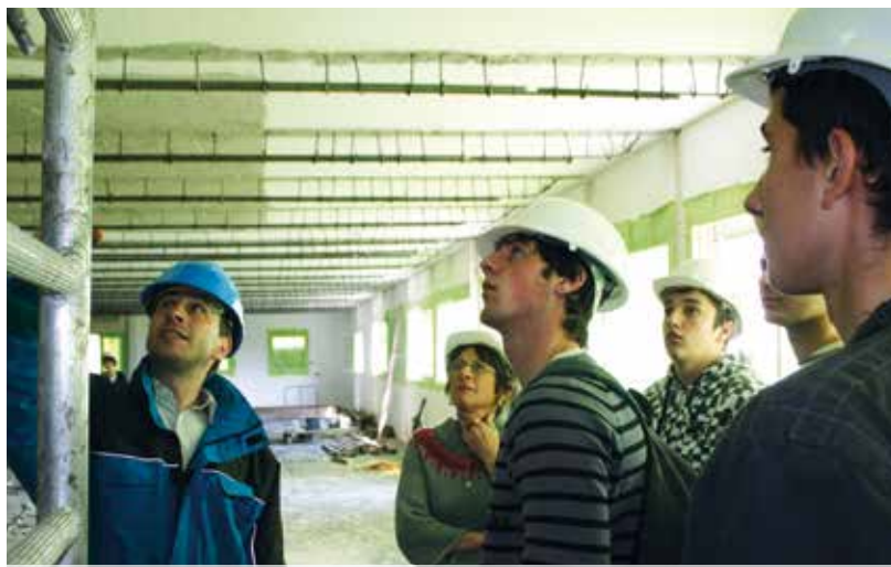
Un chantier formateur pour les élèves

Le bâtiment principal sorti de terre sera opérationnel en juillet 2017. Ce sera la vitrine du projet.