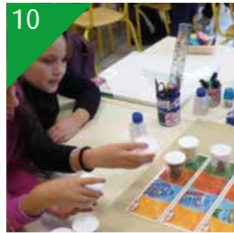
10 ENVIRONNEMENT Des actions pour réduire les déchets