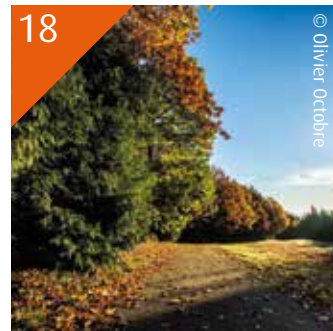
18 DANS LES COMMUNES Villemagne l'Argentière Combes