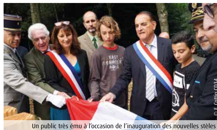
Un public très ému à l'occasion de l'inauguration des nouvelles stèles