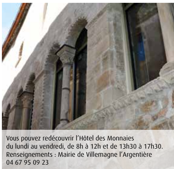
Vous pouvez redécouvrir l'Hôtel des Monnaies du lundi au vendredi, de 8h à 12h et de 13h30 à 17h30. Renseignements : Mairie de Villemagne l'Argentière 04 67 95 09 23