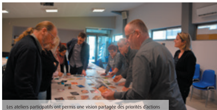
Les ateliers participatifs ont permis une vision partagée des priorités d'actions

« Nous sommes passés de la houille charbon à la houille verte »