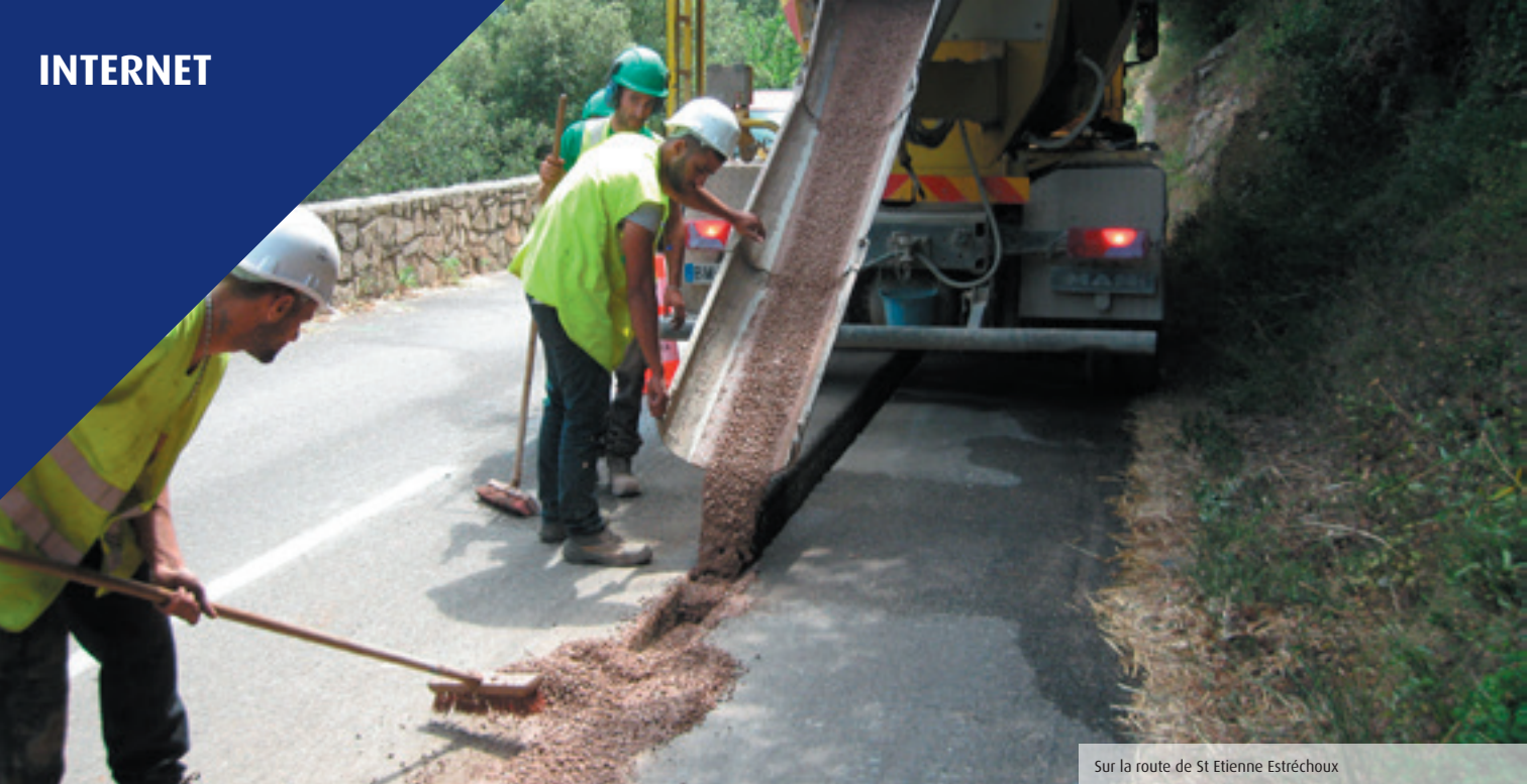
Sur la route de St Etienne Estréchoux