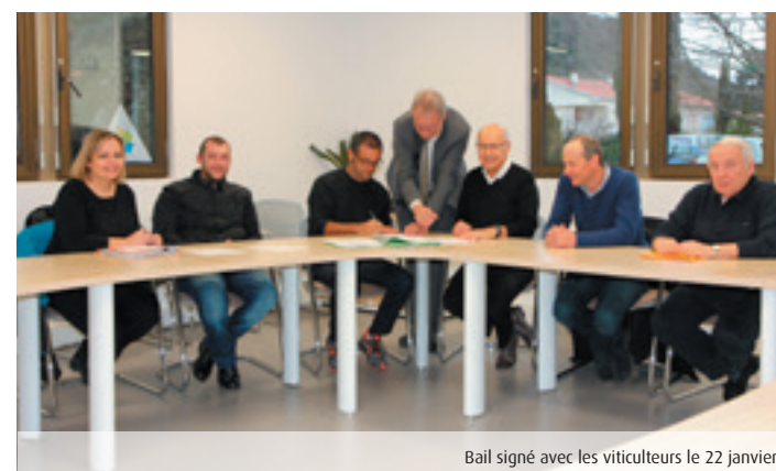
Bail signé avec les viticulteurs le 22 janvier

Pour connaître la date de votre raccordement, un site, www.numerique.herault.fr Lorsque votre quartier ou votre commune sera raccordé vous n'aurez plus qu'à contacter le fournisseur d'accès de votre choix.