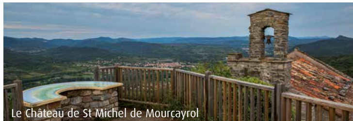
Le Château de St Michel de Mourcaïrol

Très active, cette petite commune de 603 habitants est caractérisée par son village central des Aires, suivi du Moulinas, et ses petits hameaux à flanc de montagne (Margal, les Abbés, Cantemerles, Violès...). Son principal atout : ses entreprises qui génèrent pas moins de 110 emplois sur la commune. D'un point de vue touristique et patrimonial, le château de St Michel de Mourcaïrol est un site remarquable qui accueille plus de 3 000 visiteurs