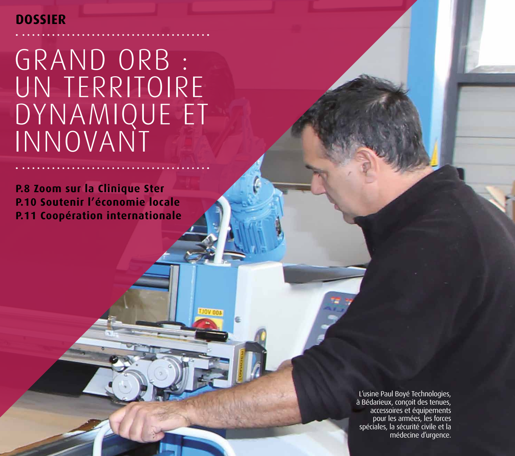
L'usine Paul Boyé Technologies, à Bédarieux, conçoit des tenues, accessoires et équipements pour les armées, les forces spéciales, la sécurité civile et la médecine d'urgence.

P.8 Zoom sur la Clinique Ster P.10 Soutenir l'économie locale P.11 Coopération internationale