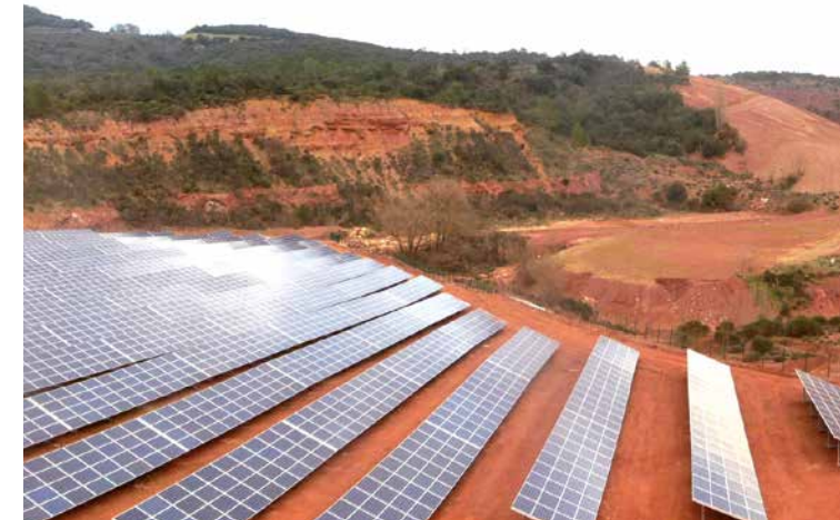
Le parc photovoltaïque des Terres Rouges à Bédarieux.

La première tranche porte sur 20 hectares de panneaux photovoltaïques. D'une puissance de 7,1 MW, elle produira près de 10 millions de kWh par an soit la consommation d'environ 4000 habitants. Le premier kilowattheure solaire a été injecté dans le réseau le 26 janvier dernier. Une deuxième tranche de travaux débutera l'été prochain. Elle portera sur 15 hectares de panneaux mobiles dernière génération dont la mise en service est prévue pour fin 2015. Cette deuxième tranche fait partie des 16 projets sélectionnés par le Ministère de l'Écologie, du Développement Durable et de l'Énergie parmi plus de 200 dossiers au niveau national. D'une puissance de 5,6 MW, elle produira plus de 8 millions de kWh soit la consommation d'environ 3000 habitants. Sa mise en service est prévue pour la fin de l'année.