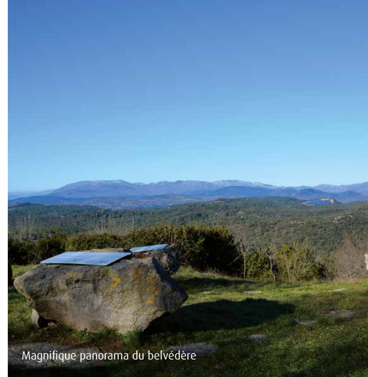
Magnifique panorama du belvédère

Perché à une altitude de 380 mètres, le petit village de Carlenças, 132 habitants, domine toute la vallée de l'Orb. Berceau de la culture du pois chiche, celui-ci est devenu l'emblème de la commune. Alliant modernité et authenticité, le village est caractérisé par la présence de magnifiques villas contemporaines et d'anciennes maisons en pierre. À 300 mètres du centre, un belvédère permet de découvrir l'histoire des roches de la région et offre également un magnifique panorama avec vue sur les massifs de l'Espinouse et du Caroux. Par beau temps, il est également possible d'apercevoir la chaîne des Pyrénées et le Mont du Canigou. Au hameau de Levas, ancienne villa gallo-romaine, une église du 12 ème siècle, entièrement restaurée en 2005, se signale par son important clocher rectangulaire.