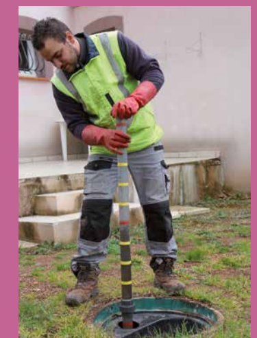
Le technicien effectue des contrôles des dispositifs d'assainissement non collectif.

Contact : 04 67 23 78 03 - spanc@grandorb.fr