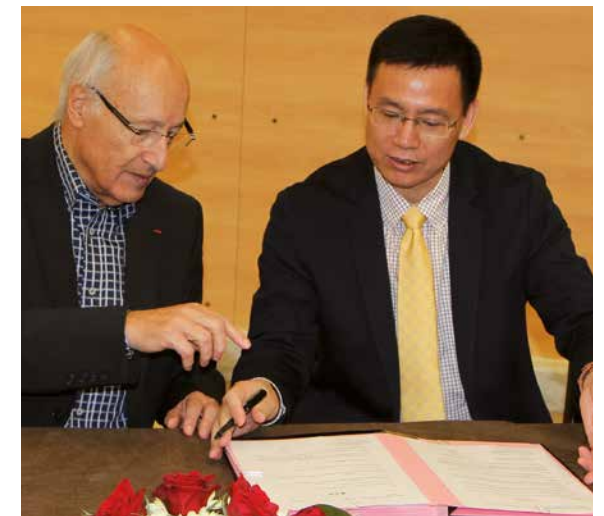
Une intention de coopération signée avec la ville de Jinjiang.